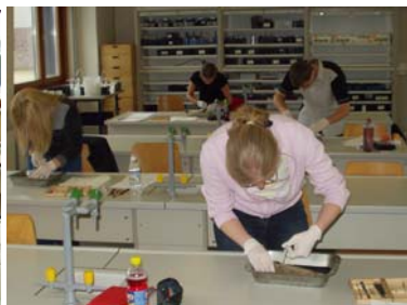
NAWI SCHW BU2